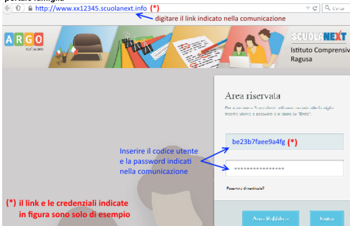
Fig. 2 portale famiglia

Basta avere un pc collegato ad internet, aprire il browser di navigazione ( consigliati mozilla firefox e google chrome ) e digitare o incollare il link indicato nella comunicazione.